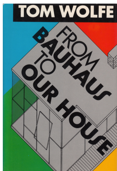
Tom Wolfe, From Bauhaus to our House (1981). Cover