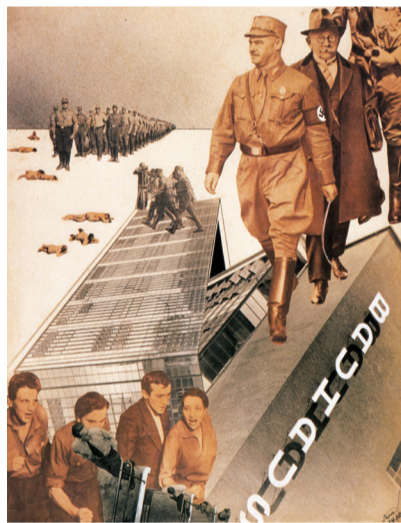
Iwao Yamawaki, Der Schlag gegen das Bauhaus , 1932. Fotocollage