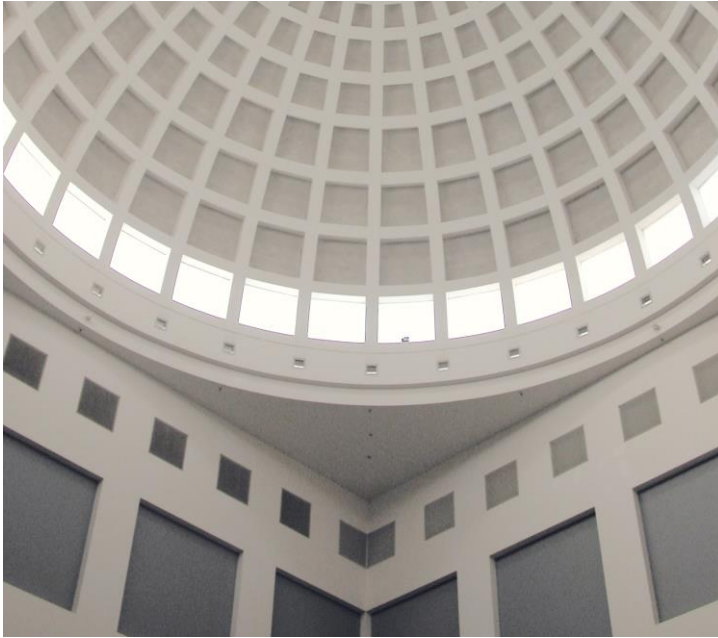
Abbildung 2.3: Innenansicht der Kuppel der Badischen Landesbibliothek