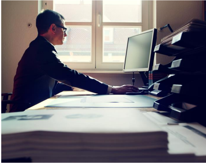
Abbildung 2.2: Wissenschaftler an seinem Arbeitsplatz