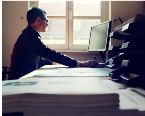
Abbildung 2.2: Wissenschaftler an seinem Arbeitsplatz