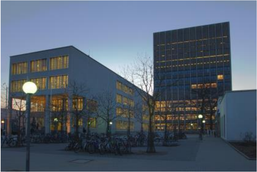
Abbildung 1.1: Außenansicht der KIT-Bibliothek Phasellus accumsan cursus velit. Vestibulum ante ipsum primis in faucibus orci luctus et ultrices posuere cubilia Curae

Bibendum sed, posuere ac, mattis non, nunc. Vestibulum fringilla pede sit amet augue. In turpis. Pellentesque posuere. Praesent turpis. Aenean posuere, tortor sed cursus feugiat, nunc augue blandit nunc, eu sollicitudin urna dolor sagittis lacus. Donec elit libero, sodales nec, volutpat a, suscipit non, turpis. Nullam sagittis. Suspendisse pulvinar, augue ac venenatis condimentum, sem libero volutpat nibh, nec pellentesque velit pede quis nunc. Vestibulum ante ipsum primis in faucibus orci luctus et ultrices posuere cubilia Curae; Fusce id purus. Ut varius tincidunt libero.