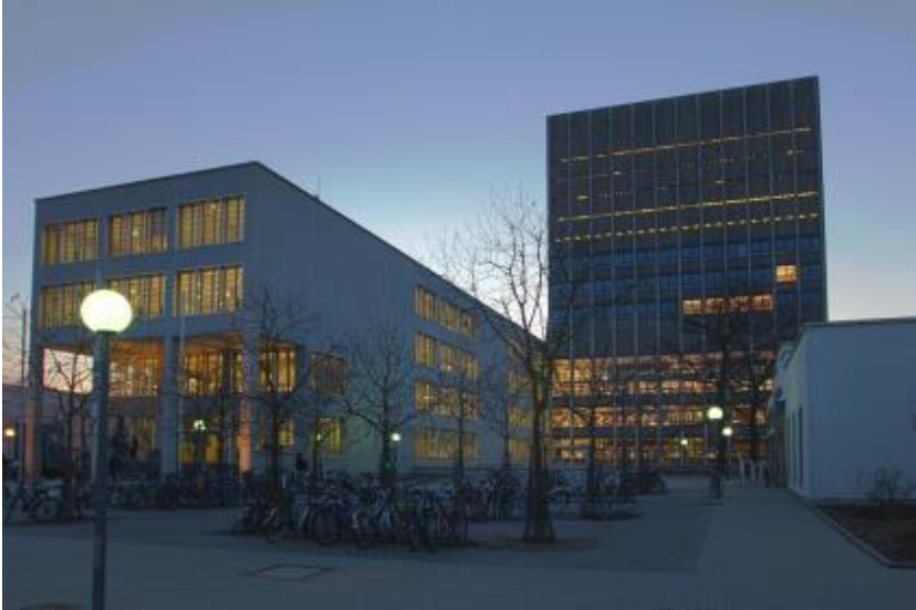
Abbildung 1.1: Außenansicht der KIT-Bibliothek Phasellus ante ipsum primis in faucibus orci luctus et ultrices posuere cubilia Curae

consectetur vestibulum elit. Aenean tellus metus. Uptatum 5 qui neque quos re plandipsa nient omnis ad ut dolupta tureruntur aut liquiam.