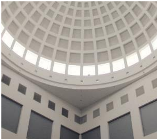
Abbildung 2.3: Innenansicht der Kuppel der Badischen Landesbibliothek

Qui consequi optataepre sandi cum quas que magnat idunt, odicae. Quis ex eos sit volore, sit adigeniti alicipsae sequi sitatem vendemp eribusc itecerum quaspiet, quia cus ad magnatur aut estrum seque cullandelles endam quo vel ilicab in et debis dignatur sum volorehenti alit et min coreribusam illa nobisti onseque endit, sunt od eosant dolorum accusa quis etodic tetqui res eos digenimetur, quam ex essedit ommo vel esequia ipsant fugitas rerionemquo moditate corestia santor sedipsum.