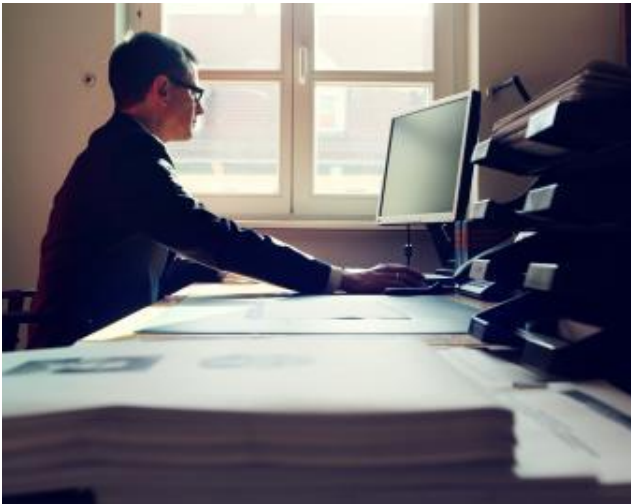
Abbildung 2.2: Wissenschaftler an seinem Arbeitsplatz

Quam volum voluptenti omnimpos sit perovid et ut opti voluptas es aut optatus quibus aliquo cumenis veliquis esti tem volupiduciam corum dolum quisciis sa nobit excerumquo doluptate min parcimperro quibus plique il id quam quaestet apercip iendand ipsandebit, venist earchic ipsaniendis modit apernamus. Avolornullabo. Ritataie natquo volore et alluminat haspit rimanteum veliat doluptate min parcimperro anus.