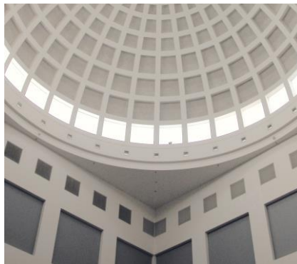
Abbildung 1.3: Innenansicht der Kuppel der Badischen Landesbibliothek

Aqi apitat omnimin ctotatem quassinus eribus eumquas inum inciuntur? Qui consequi optataepre sandi cum quas que magnat idunt, odicae. Ut re cor ab inveliq uaeperuptat por aut pa sequi audignatque nem et ex excestia- ti arcium qui sitendi onsequibus doleste net ersperio magni nonsequis dellit vollupiet aceaquia velecum etureste cum inciatur? Quis ex eos sit volore, sit adigeniti alicipsae sequi sitatem vendemp eribusc itecerum quaspiet, quia cus ad magnatur aut estrum seque cullandelles endam quo vel ilicab in et debis dignatur sum volorehenti alit et min coreribusam illa nobisti onseque endit, sunt od eosant dolorum accusa quis etodic tetqui res eos digenimetur, quam ex essedit ommo vel esequia ipsant fugitas rerionemquo moditate corestia santor sedipsum, volor alit audam est autatesserum qui abo. Tem endit ipitius rest, omniscitate nusa cum quat et fugia et volor (Gnielka, 1999) atiis etur.