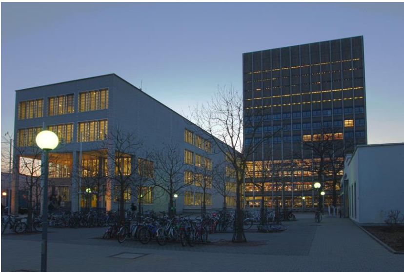
Abbildung 1.1: Außenansicht der KIT-Bibliothek Phasellus accumsan cursus velit. Vestibulum ante ipsum primis in faucibus orci luctus et ultrices posuere cubilia Curae; Sed aliquam, nisi quis porttitor congue.

consectetur vestibulum elit. Aenean tellus metus. Uptatum 5 qui neque quos re plandipsa nient omnis ad ut dolupta tureruntur aut liquiam. Bibendum sed, posuere ac, mattis non, nunc. Vestibulum fringilla pede sit amet augue. In turpis. Pellentesque posuere. Praesent turpis. Aenean posuere, tortor sed cursus feugiat, nunc augue blandit nunc, eu sollicitudin urna dolor sagittis lacus. Donec elit libero, sodales nec, volutpat a, suscipit non, turpis. Nullam sagittis. Suspendisse pulvinar, augue ac venenatis condimentum, sem libero volutpat nibh, nec pellentesque velit pede quis nunc. Vestibulum ante ipsum primis in faucibus orci luctus et ultrices posuere cubilia Curae; Fusce id purus. Ut varius tincidunt libero.